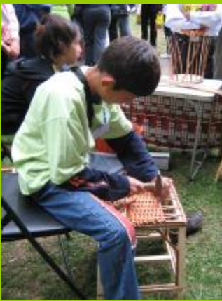
ОУ "Г.С.Раковски", с. Болярци, обл. Пловдив

Тук няма да бъдат разглеждани всички проблеми, водещи до липсата на мотивация и отпадането на децата от училище, а само онези, които могат да бъдат разрешени със социално-педагогическа работа.