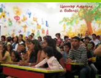
Ограмотителния център в ОУ «Хр.Смирненски» С.Водолей

В началото на учебната година по мое предложение и с тяхна помощ съставихме "Училищен календар на дейностите", в които бяха отбелязани всички мероприятия, които ще се занимаваме през тази учебна година.