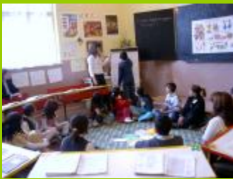
ОУ "Хр.Смирненски" С. Водолей, обл. В.Търново