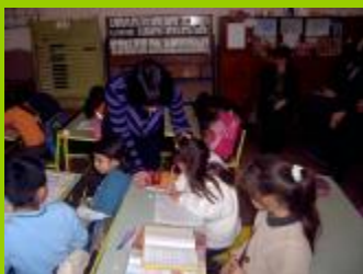
ОУ "Васил Левски" – с. Леденик, обл. В.Търново

Проблемът с недоброто владеење на български език се отнася към някои специфични групи ромци (миллета) или към маргинализираните общности, живеещи в гета. При турскоезичните ромци силен фактор е говоренето само на турски език в семейството и гледането на сателитни канали. Често това се явява проблем и за децата от турската етническа общност. Същият проблем може да бъде регистриран и при ромците, говорещи ромски език като майчин и обитаващи компактни гета. Липсата на приток на българска реч е основната причина. Към това се добавя и тенденцията ромските деца да не посещават подготвителна група. Изследванията ясно показват, че от момента в който децата влязат в мултиетническа среда, този проблем постепенно започва да отслабва.