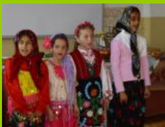
СОУ "Св.Св.Кирил и Методий" – с. Гърмен