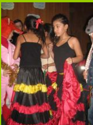
Ученици от ОУ – с. Майско, обл. В.Търново

Преподавател от ОУ "Св.Св.Кирил и Методий", с. Малорад, обл. Монтана