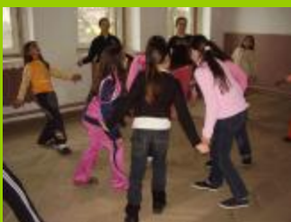
СОУ “Г.С.Раковски”, гр. Котел

Преподавател, ОУ “Св.Св.Кирил и Методий” с. Крушето, обл.В.Търново