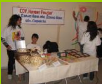
СОУ "Неофит Рилски" гр. Долна баня, обл. София

Медийното отразяване е един от най-стимулиращите фактори за участието на учениците